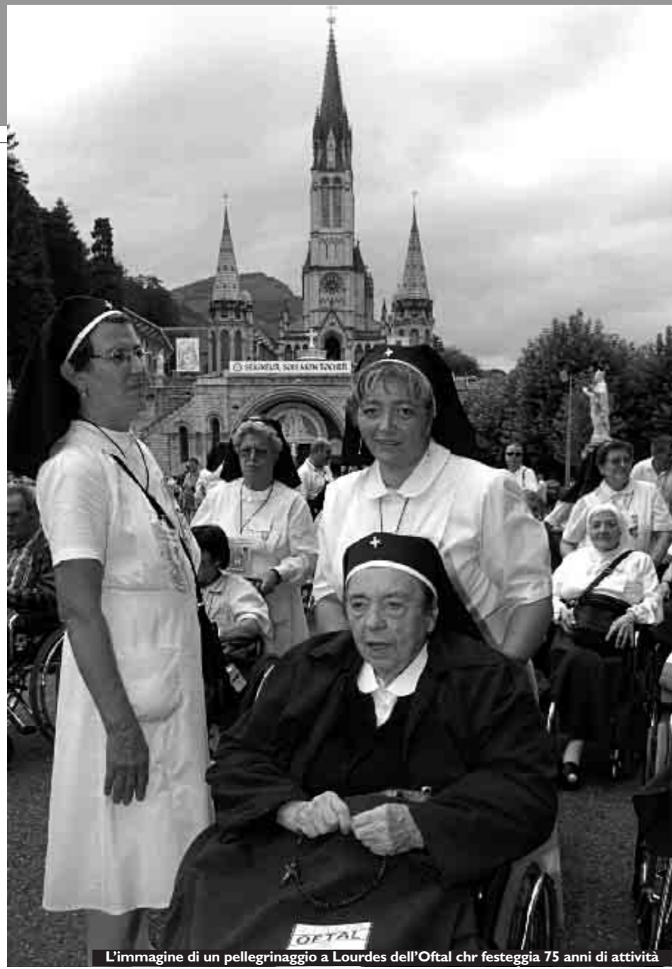
L'immagine di un pellegrinaggio a Lourdes dell'Oftal che festeggia 75 anni di attività